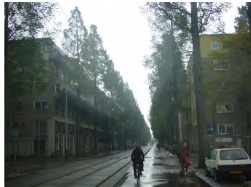
lepen in de Czaar Peterstraat