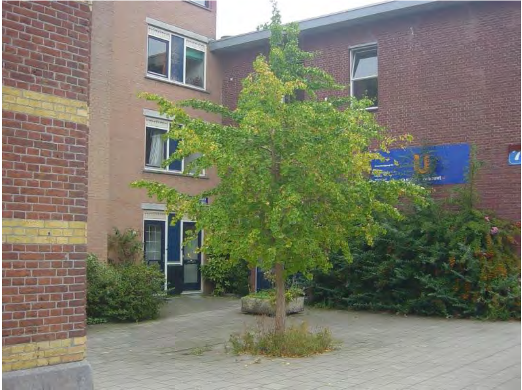
Hoogte Kadijk, zomaar een boom.

Met informele bomenstructuur (rood) wordt bedoeld dat er af en toe een boom staat in een straat, er is geen rij van bomen. Zoals bijvoorbeeld op de Hoogte Kadijk.