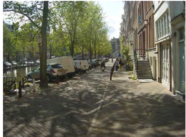
zelfde plaats, 2009