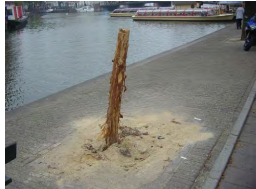
Ontbastte iep, langs de Amstel

Vooral de iepziekte is een probleem, gezien de ernst ervan en het grote aantal iepen in het centrum.