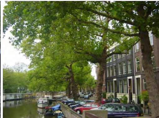
Platanen langs de Singelgracht