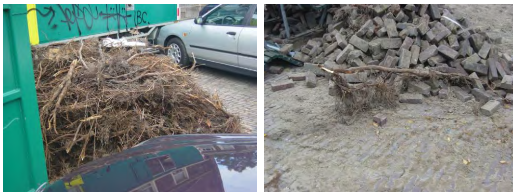
Wortelschade bij werkzaamheden, Noordermarkt

worden. Hoe dat voorkomen zou moeten worden in zich voordoende gevallen, wordt verder uitgewerkt in het Handboek Boom.