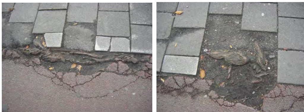
Wortelopdruk Prins Hendrikkade