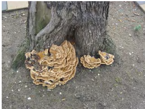
Iep aangetast door Reuzenzwam, Czaar Peterstraat