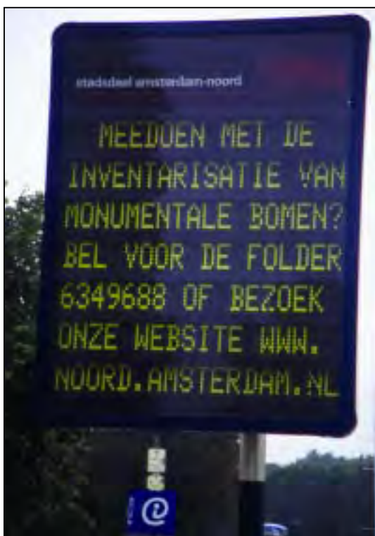
Bij een inventarisatieproject kan de afdeling Communicatie een waardevolle bijdrage leveren.

Deze afdeling zorgde onder meer voor persberichten en bewonersaankondigingen, een informatie-folder en een pagina over monumentale bomen op de website van het stadsdeel, het redigeren van teksten en het inschakelen van specifieke deskundigheid. Verder leverde Communicatie toegang tot adressenbestanden en de eigen communicatiemiddelen van het stadsdeel en adviseerde de afdeling bij vragen van de projectleider.