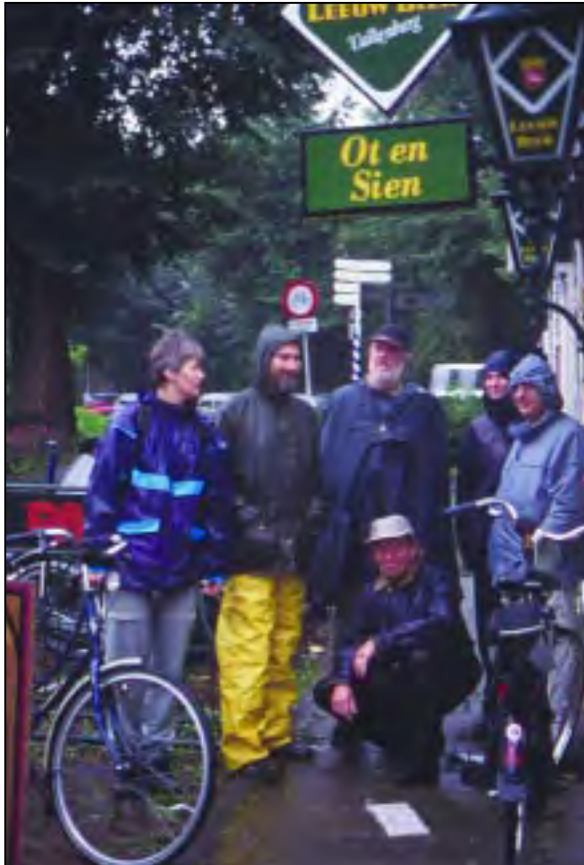
Bij de inventarisatie van de monumentale bomen in stadsdeel Noord namen bewoners deel aan de beoordelingscommissie.

De adviescommissie baseert zich op de verzamelde gegevens, de foto's én een bezoek aan de locatie. Vervolgens schrijft zij een advies aan het stadsdeel over welke bomen naar haar mening monumentaal, niet-monumentaal en, desgewenst, potentieel monumentaal moeten worden verklaard. Afhankelijk van de opdracht kan het advies van de adviescommissie ook aanbevelingen bevatten over bescherming, beheer en onderhoud van de monumentale bomen en over communicatie.