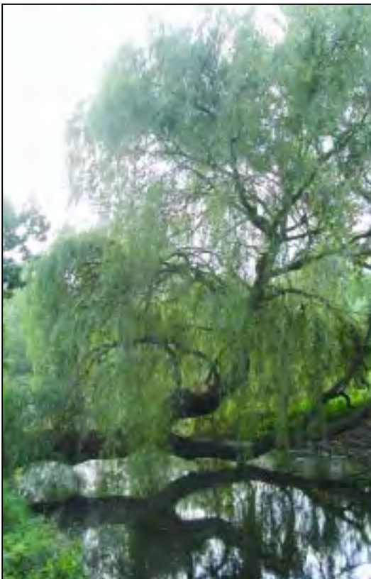
Speel- en klauterbomen hebben een bijzondere educatieve waarde. Deze treurwilg langs de Kometensingel tegenover huisnummer 427, vlakbij de Plejadenweg, is opgenomen in de lijst monumentale bomen van stadsdeel Noord.

Het beoordelen van en omgaan met monumentale bomen blijft — ondanks de criteria — onderhevig aan subjectiviteit. Daarom wordt aanbevolen om één keer per jaar onder leiding van de hoofdstedelijke bomenconsulent met alle betrokkenen in de stad bijeen te komen om aanpak en werkwijze op elkaar af te stemmen.